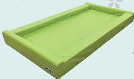
オールウレタンの安心、低床ベッド [おふとんベッドⅡ]