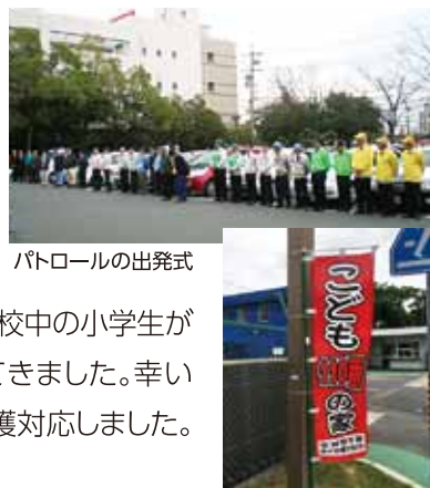
パトロールの出発式

安城事業所では安城知立安全運転管理協議会が運営する『青パト』に参加し、地域の防犯に協力しています。出勤日で「5のつく日」に毎月2名乗車で、青色回転灯を車輛の天井に取り付け、指定されたコースの巡回パトロールを長年継続しています。『こども110番』は、近隣の子供たちの非常時の避難場所として指定を受けています。一例としては、下校中の小学生が知らない人に写真を撮られたとの事で、避難されてきました。幸い事件性はありませんでしたが、ただちに警備室で保護対応しました。防犯活動への協力で小学校よりお礼を頂きました。